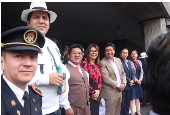
Desfile de los mercados