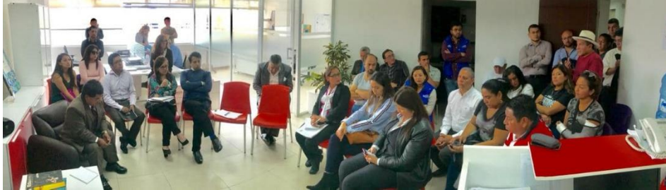
Foto: mesa de trabajo con comerciantes de la Mariscal