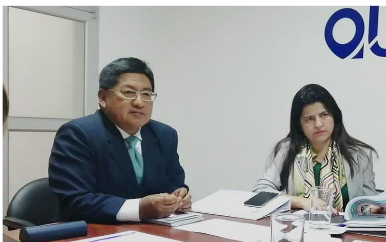
Foto: sesión de directorio

Numero de resoluciones que ha emitido el directorio: 21