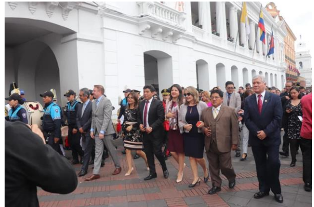
Evento de festividades de Quito