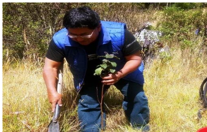
Foto: siembra en el Cerro Ungüi.