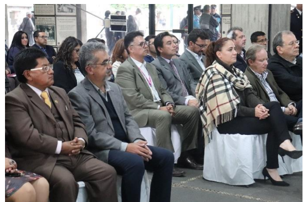
Evento en el Palacio Municipal