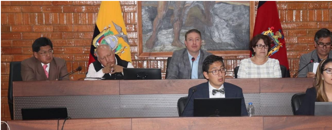
Foto: sesión de la Comisión de Presupuesto