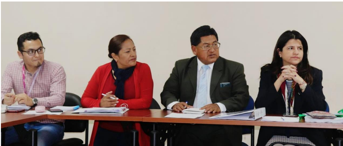
Foto: Sesión de Comisión de Propiedad y espacio Público

Como presidente de la Comisión de Propiedad y Espacio Público, he presentado al Concejo Metropolitano las resoluciones sobre: renovación de convenios de uso y de comodatos, autorización de cambio de categoría de bien municipal de dominio público a bien municipal de dominio privado y enajenación directa de faja de terreno; que fue importante para que se inicie el proceso de regularización de asentamiento en el bien de propiedad municipal en Calderón.