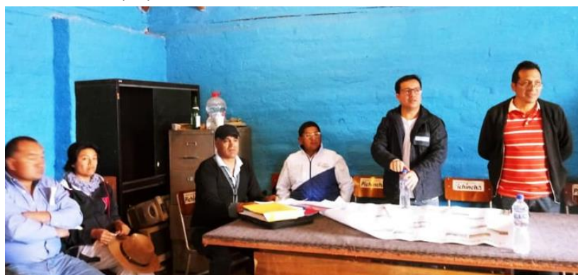
Foto: mesa de trabajo en la Cocha de Pifo