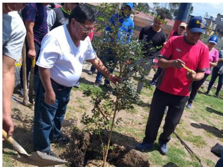
Foto: Reforestación en Aida León