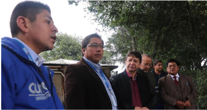
Foto: Inspección de área de muro de contención en el Mercado Mayorista