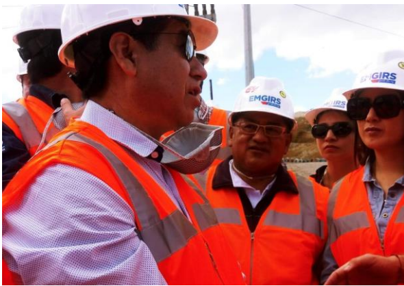
Visita técnica organizada por EMGIRS

Durante el 2019, asistí a cerca de 40 eventos organizados por las Empresas, Secretarías y demás entidades municipales, con el fin de apoyar los programas municipales y atender invitaciones de sus directivos y del Alcalde Metropolitano.