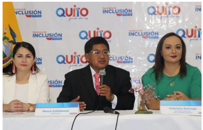
Foto: rueda de prensa de la inauguración Casa Arupo