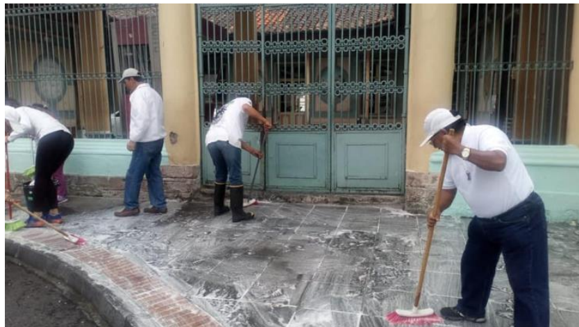
Foto: limpieza de calles en el barrio La Loma Grande