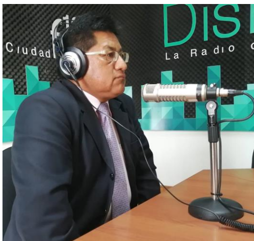
Foto: entrevista en radio Pacha

Radio, televisión, prensa escrita y medios on-line destinaron espacios para difundir el trabajo realizado, entre ellos: Radio HCJB, Canal UNO, Radio Municipal, Radio de la Asamblea, Olive Fuerzas del Sur, Radio Pacha, Chasqui Deportivo, revista Al Borde de Campo, Ultimas Noticias, entre otros.